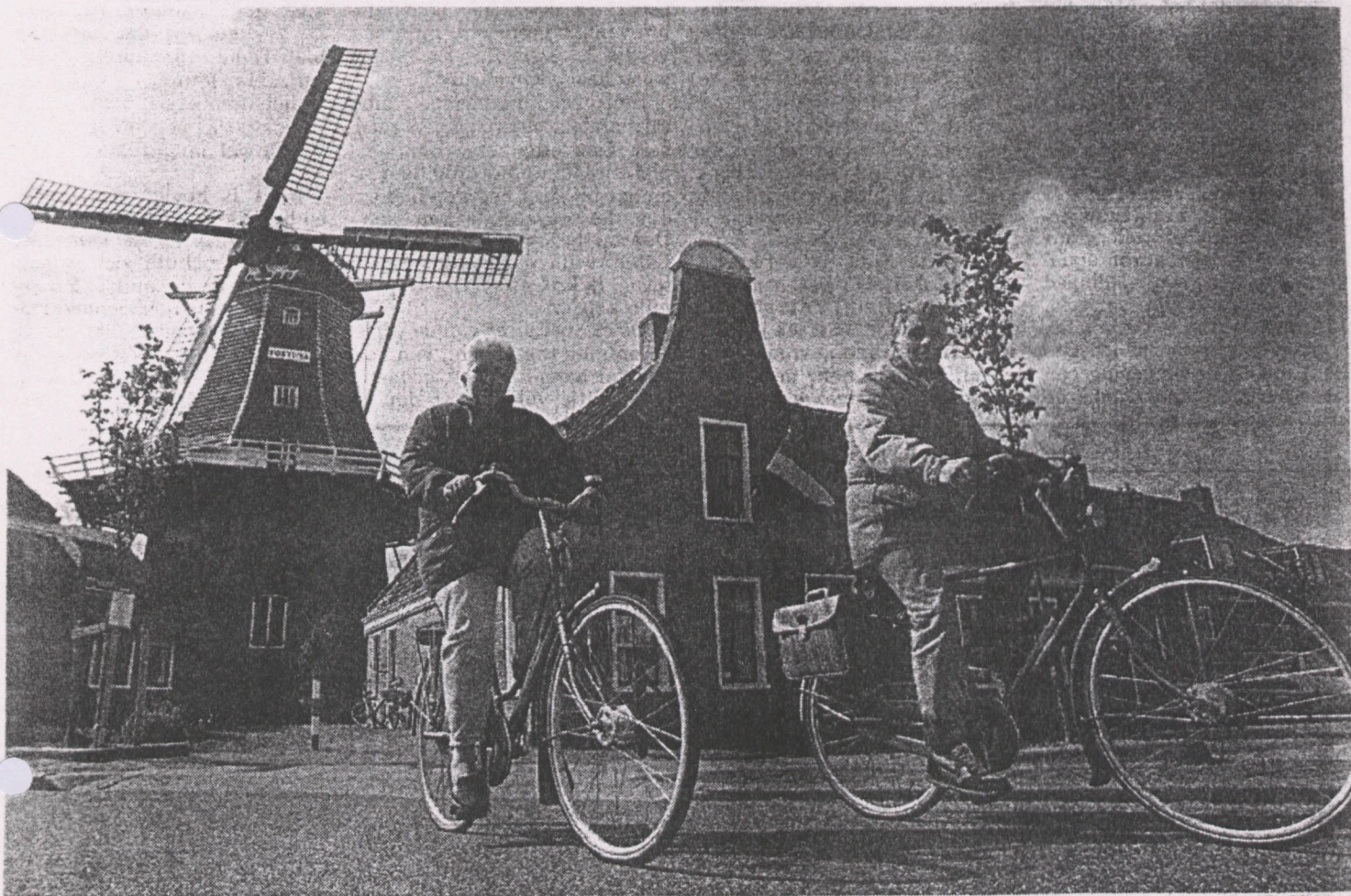
■ In Noordhorn namen veel belangstellenden een kijkje in de molen.