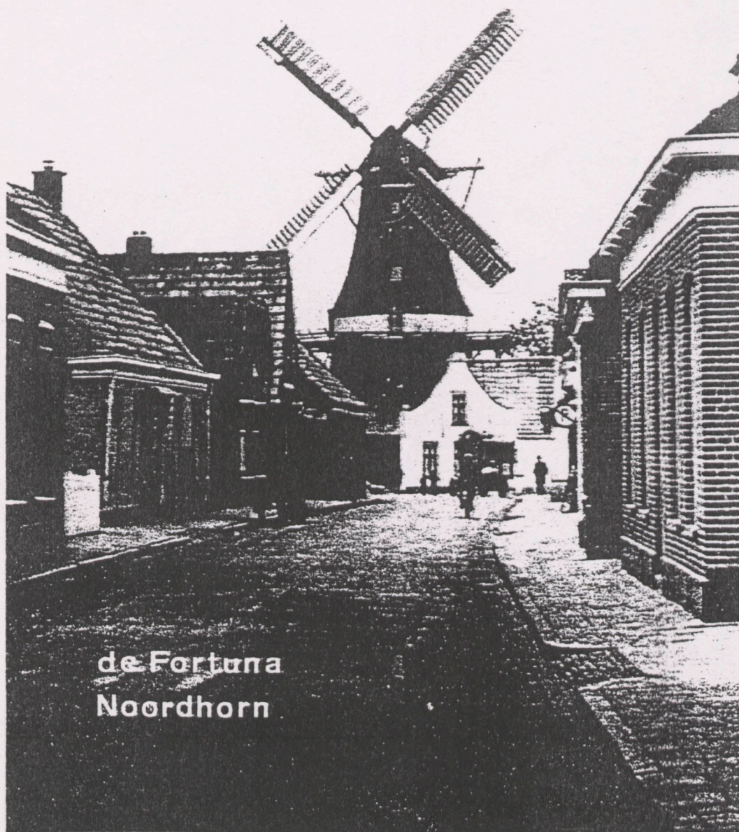
de Fortuna Noordhorn