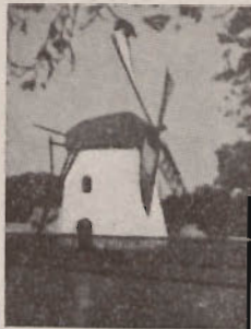
Mostert's Meul Kaapstad