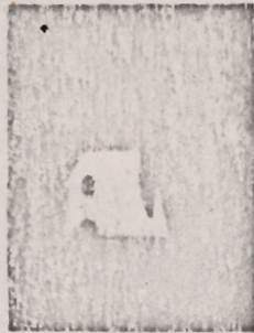
Molens' Moul Koppeld