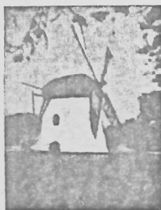
Mostert's Meul Kaapstad