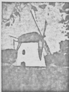
Mostert's Meul Kaapstad