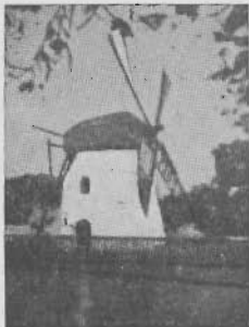
Mostert's Meul Kaapstad