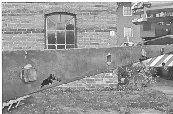
Commentaar overbodig bij de oude roede....

Er is tevens een nieuwe rechter lange schoor aangebracht. De inkeping op de lange spruit vertoont gelukkig nog geen rotte plek. Het bijzondere is dat die lange spruit van pitch-pine hout tweedehands in 1903 (101 jaar geleden!) in de kap is geplaatst. Deze houtsoort is met zo'n kwaliteit tegenwoordig