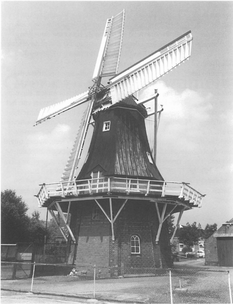
De molen Windlust , hier fier geportretteerd in 1994, heeft aardig wat stormen doorstaan.