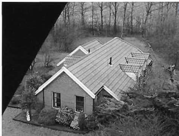
HET HUIS VAN HENK KLÖPPING GEZIEN VANAF MOLEN DE GROOTE POLDER TE SLOCHTEREN

Henk: “Bij ons was het een compleet oerwoud. Ik kon zelf makkelijk bomen rooien en heb zo zelf mijn biotoop ingericht. Soms wel met hulp van onze Molenstichting, zoals bij het rooien van drie grote peppels. Nu zijn er nog wat kastanjes, maar die staan bij de maalschuur, daar heb je eigenlijk geen last van. Een voordeel van het wonen bij de ‘eigen molen’ is dat je bij mooi weer ook snel kunt besluiten om te draaien, omdat je de omstandigheden kent. En als de molen draait komen er mensen op af. Soms parkeren ze alleen