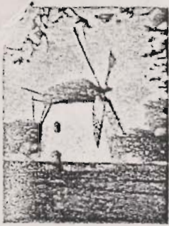
Mostert's Molens Kaapstad