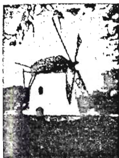
Mostert's Meul Kaapstad