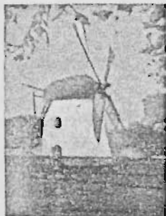
Mostert's Meul Kaapstad