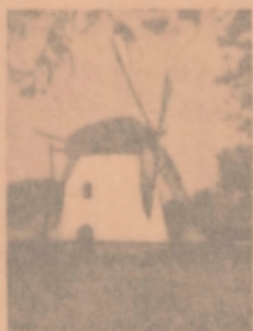
Molens' Floor Kasportel