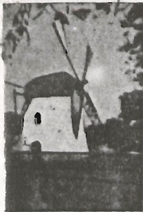
Mooster's Meul Kaapstad