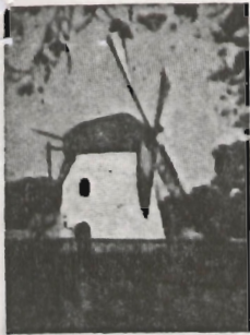
Mosier's Meul Kaapstad