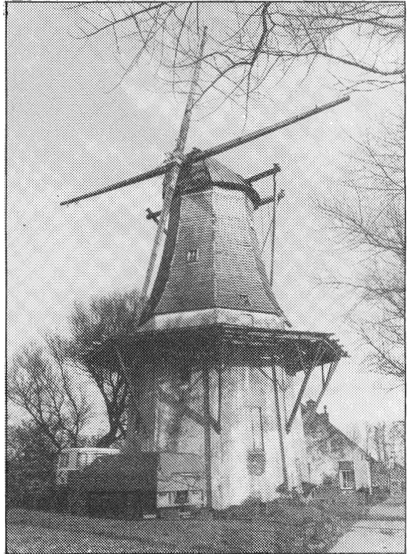
De molen van Wetsinge, gefotografeerd in 1981 en nu nog verder vervallen....

En nu de molen. Het is een achtkante bovenkruier met stelling. De kap heeft geel-geverfde vertikale gepotdekselde planken bekleding. Het achtkant is horizontaal gepotdekseld en grijs geverfd met witte biezen op de hoeken. Het aantal Groninger molens met de karakteristieke witte biezen gaat zienderogen achteruit. Niet door afbraak etc. maar door het wegwerken van deze biezen (Garnwerd, Kolham Usquert, Loppersum enz.). Het tussenstuk en de onderachtkant zijn van steen en wit bepleisterd. Nu zitten er nog kale roeden op; destijds hadden ze zelfzwiching met dwarskleppen en 'verbusselde' voorzomen. Via gammele inrijdeuren komen we dan binnen: er