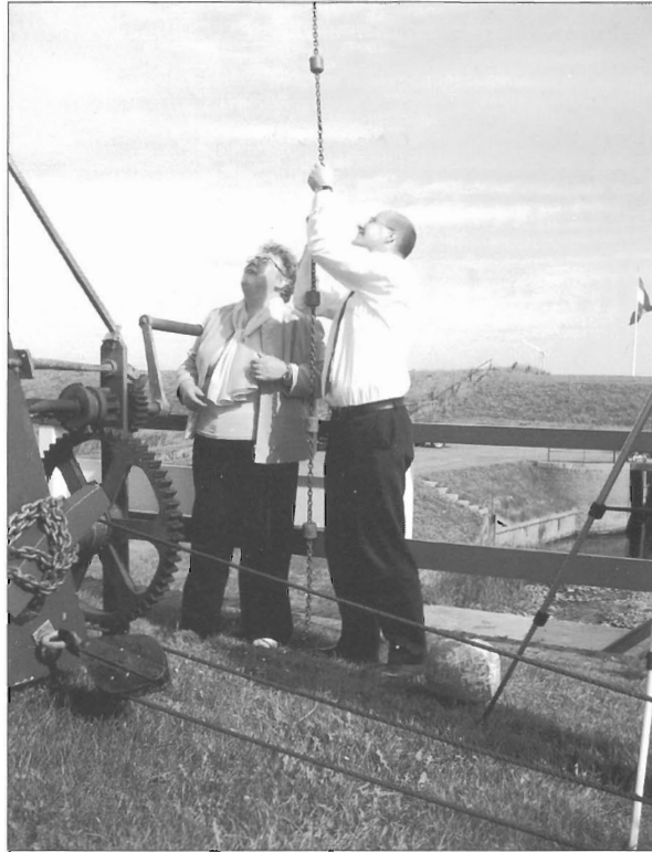
Kruien en vang lichten – daar draait het om