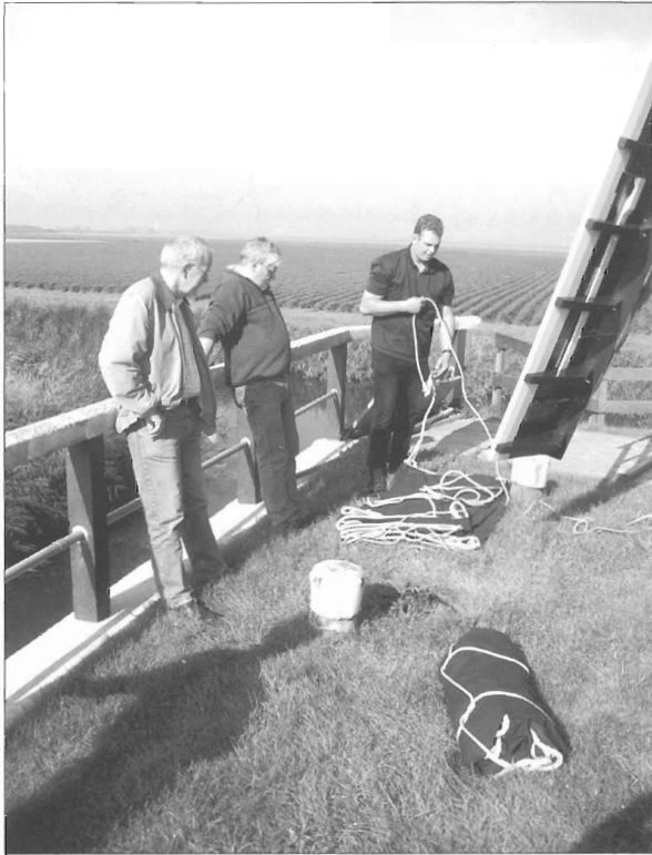
De Goliath nieuw in de kleren