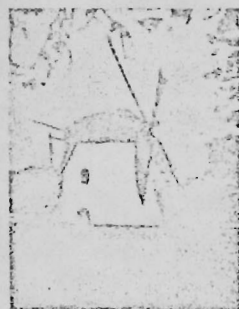
Mostert's Meul Knapstad