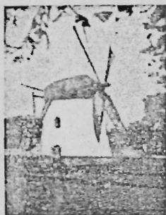
Moster's Meul Kaapstad