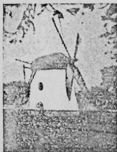
Mostert's Meul Kaapstad