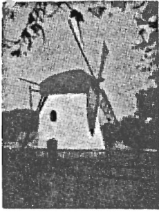
Mostert's Meul Kaapstad