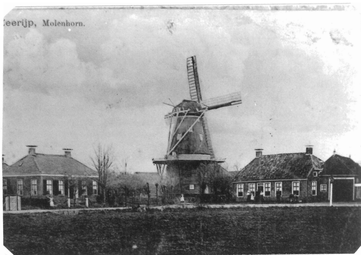
DE MOLEN DE LEEUW TE ZEERIJP, UITGERUST MET ZELFZWICHTING, OP EEN OUDE ANSICHTKAART.