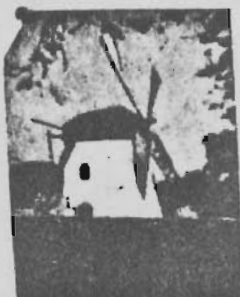
Mostert's Meul Kaapstad