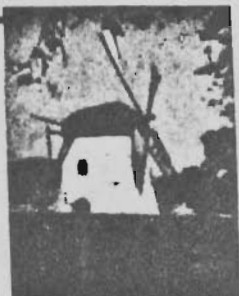
Mostert's Meul Kaapstad