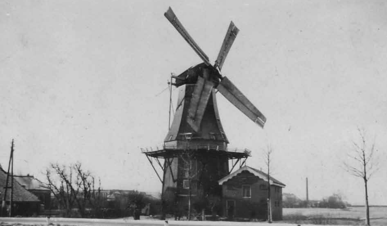
DE MOLEN 'DE HOOP' MET HET PAKHUIS IN EEN WINTERS LANDSCHAP, OPNAME NA 1936.