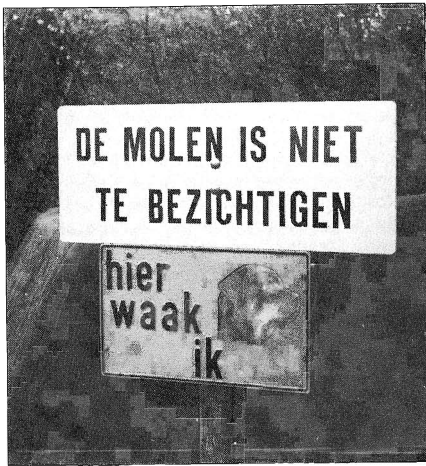
Dergelijke borden kunnen wij nóg liever missen als kiespijn!

De molen is gerestaureerd en staat weer mooi te wezen tegen een woud van hoog-