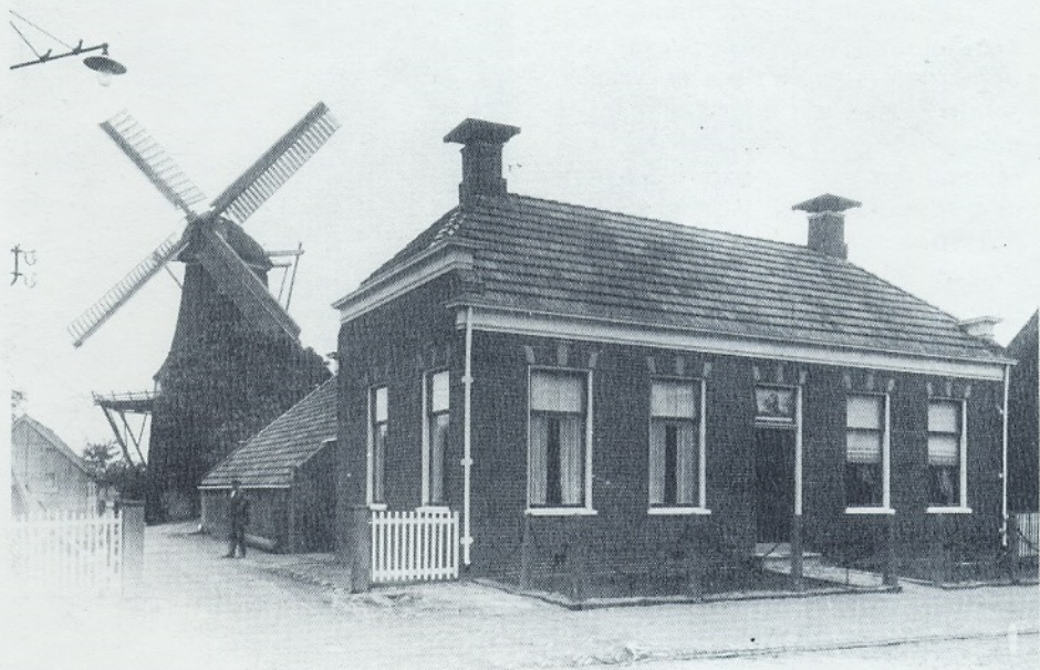
De molen van Voogd te Aduard in betere tijden.