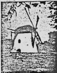
Mosteri's Meul Kaapstad