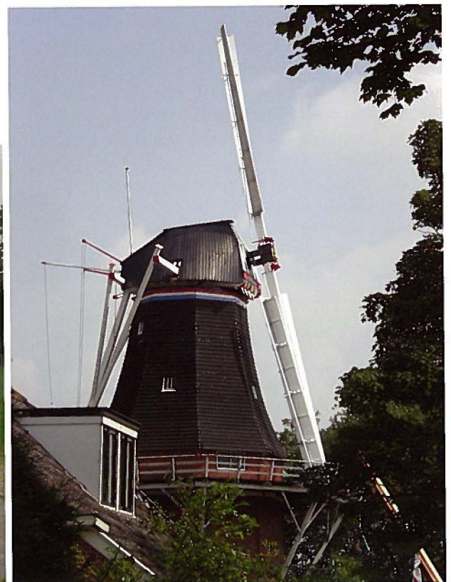
MOLEN DE LEEUW TE OLDEHOVE, EVEN MET ÉÉN ROEDE