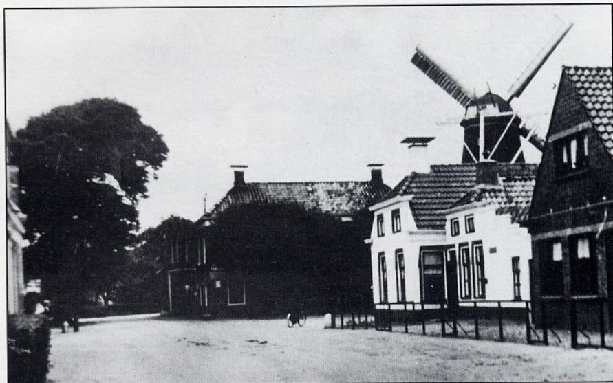
De Hoofdstraat te Pieterburen omstreeks 1950, vanuit het westen gezien. Het grote dak in het midden is van het café Kuipers (later Elinga) met "doorrit" en daarnaast het witte postkantoor. Rechtsachter de verdekkerde en zelfzwich- tende molen "De Vier Winden".