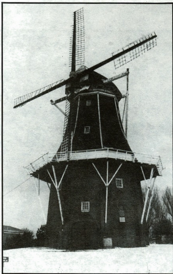
De vervallen molen "Eva" te Usquert, gefotografeerd op 12 februari 1983.

De toestand van de molen "Eva" wordt steeds slechter.