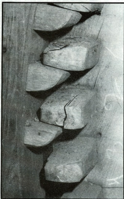
Door het verzakken van de bovenas oefent zich een geweldige druk uit op de pal, zodat een kam van het bovenwiel gebroken is.

Wij willen de Vereniging Vrienden van de Groninger Molens geen concurrentie aandoen en zullen dan ook proberen om nieuwe leden voor de vereniging te werven. In de korte tijd, dat ik zelf lid ben van de Vereniging Vrienden van de Groninger Molens, ben ik veel wijzer geworden. Ik heb veel geleerd tijdens de molenexcursie van september j.l. en ook de bezichtiging van de oliemolen "Woldzigt" te Roderwolde tijdens de bijeenkomst van de vrijwillige molenaars op 2 oktober 1982, waarbij ik als gast van een van de aanwezige molenaars aanwezig was, heeft een diepe indruk op mij gemaakt. Ik weet nu ongeveer hoe een molen werkt, maar verder ben ik niet technisch op het gebied van molens. Alles wat ik weet, komt uit het Groninger Molenboek en het boek 'Kijk op Molens'.