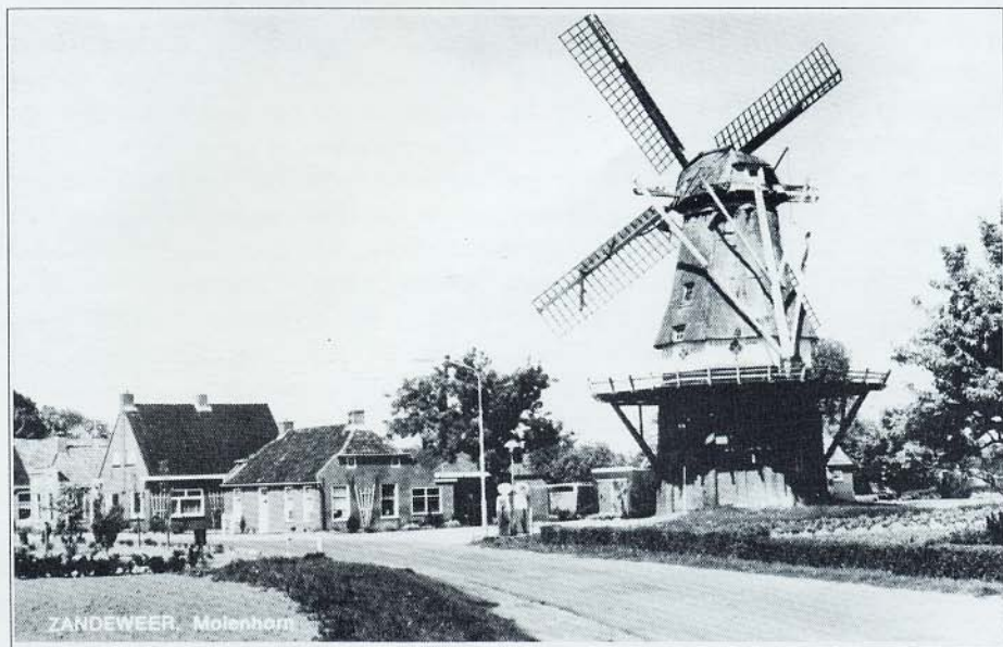
Koren- en pelmolen Windlust te Zandeweer. In 1818 als grondzeiler gebouwd en in 1886 verhoogd. (foto 1972, collectie P. van Dijken)

bouw aan de Molen horn kreeg onze grondkorenmolen last van windbelemmering en zodoende werd de molen in 1886 verhoogd met een ca. 5 meter hoog stenen onderachtkant tot een stellingmolen waardoor de windvang weer veilig was gesteld. Het omvangrijke karwei werd geklaard door dorpsstimmerman Schoo welke later naar Amerika is geëmigreerd. Schoo gebruikte voor de zolders welke extra gelegd werden ronde onderslagbalken vermoedelijk afkomstig van de afbraak van een boerenschuur of iets dergelijks. Dit om de kosten te drukken. Bij een nieuw als stellingmolen gebouwde molen zijn deze balken immers altijd rechthoekig van vorm. Ook het interieur onderging een grondige wijziging. Van de twee aanwezige koppels maalstenen verdween één en de molen werd tevens