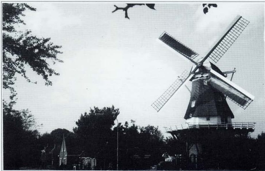
Een recente foto van koren- en pelmolen Windlust te Zandweer (foto: d.d. 28 september 1993, P. van Dijken)