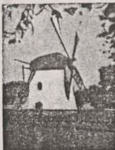
Mostert's Meul Kaapstad