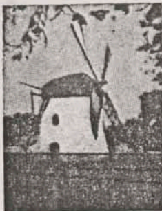
Mostert's Meul Kaapstad