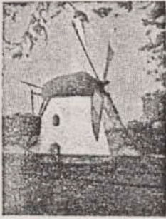
Mostert's Meul Kaapstad