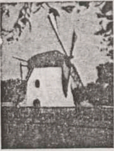
Mostert's Meul Kaapstad