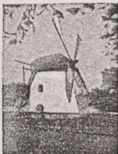
Mostert's Meul Kaapstad blad III