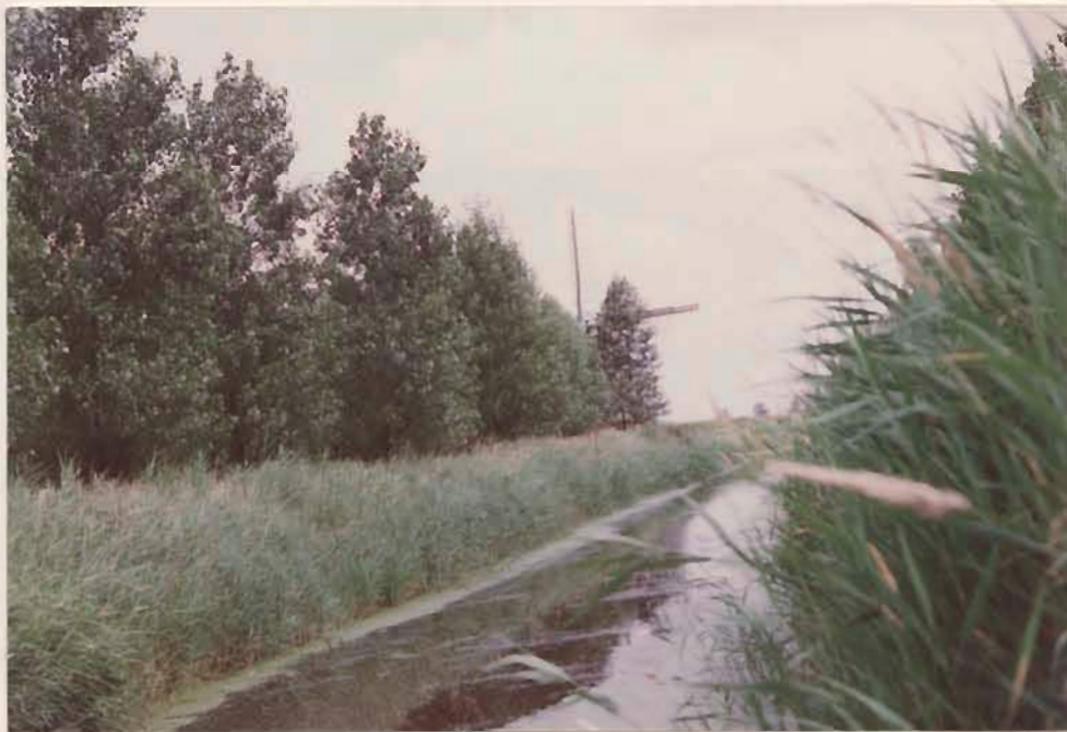
molentocht richting molen

Ter illustratie volgt een foto-serie van de Kloostermolen met omgeving: