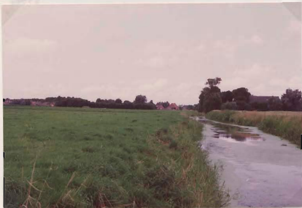
Vismaar, rich- ting boerderij Gebr. Bos