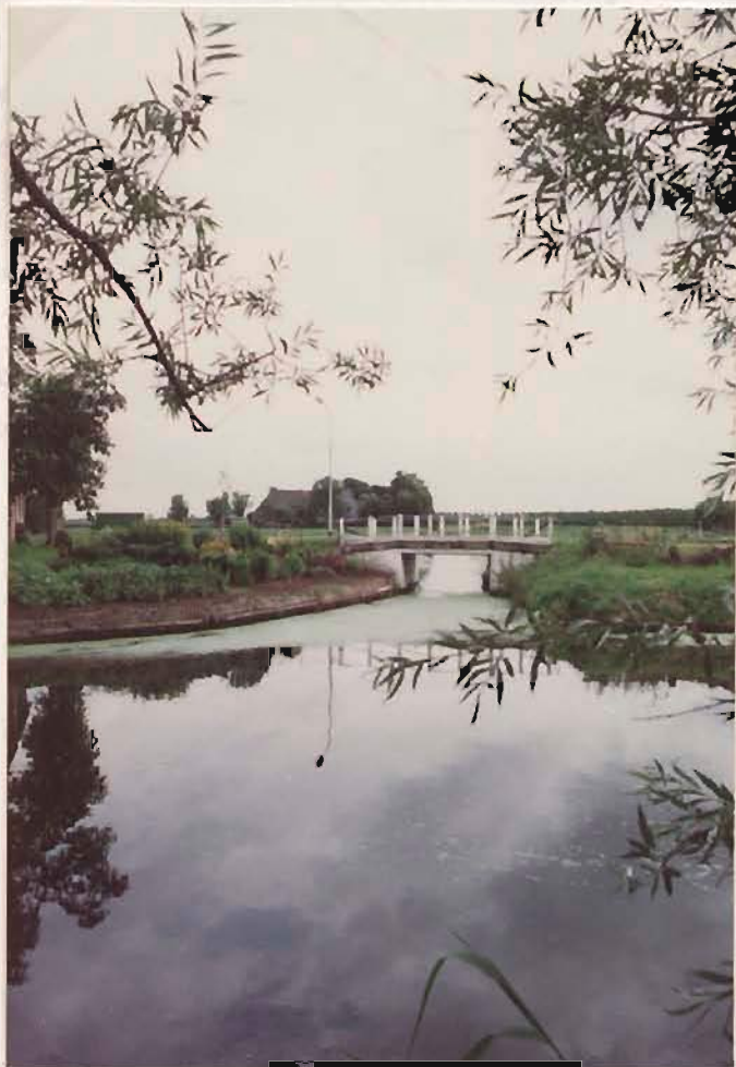
uitmondung Vismaar in het Damster- diep

Bijlagen 1. situatietekening 1. zwitser E. J. J. J. verzonden naar Politicuscommissie Commissie van Leden E. en W. van Leden Waterschap Fivellings Zuiveringscommissie