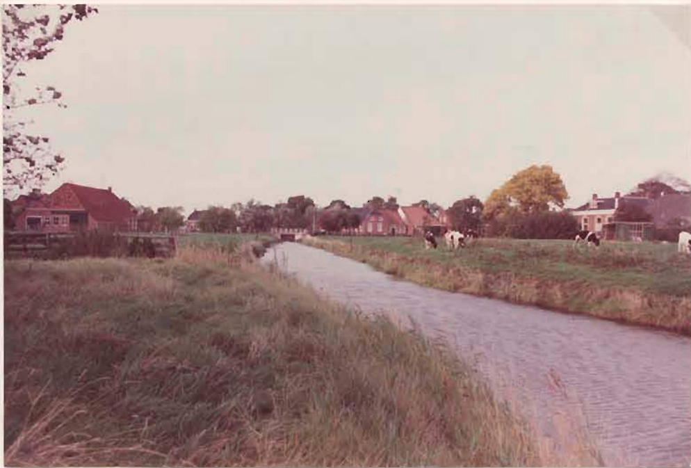
laatste gedeelte Vismaar

... van zuiden van Gar- ... al zien. De Klooster- ... laatste ... gedeelte ... Vismaar ... rentuurd