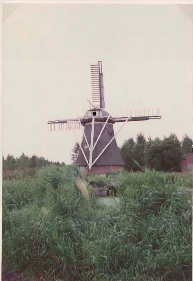
de molen, beeldbe- palend voor het landschap