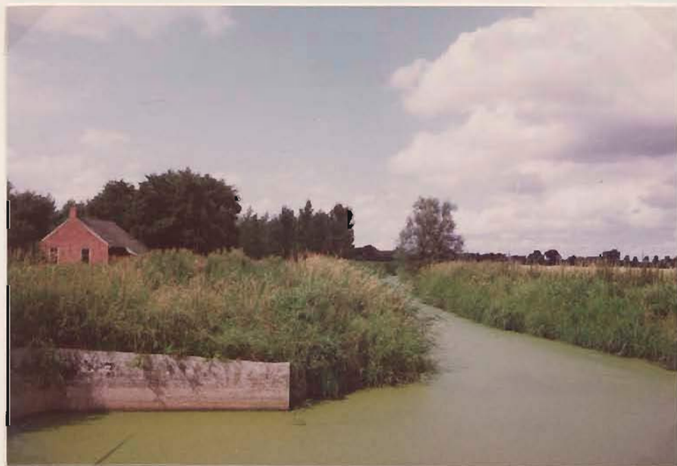
uitwatering, met het ge- gin van het Vismaar