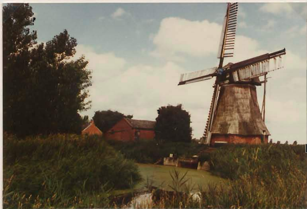
de molen, naast het bos, links de molen- tocht