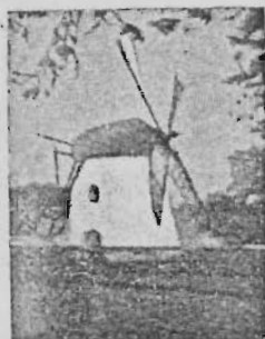
Mostert's Meul Kaapstad