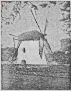
Mostert's Meul Kaapstad