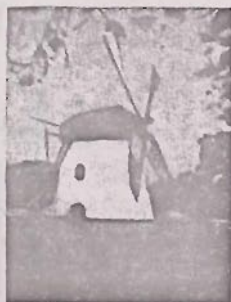
Moster's Meul Kaapstad