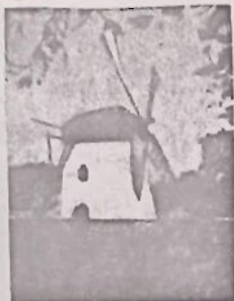
Mostert's Meul Kaarstad