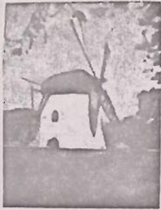
Moster's Meul Kaapstad