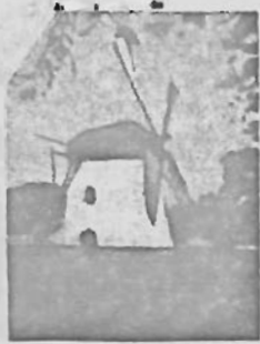
Mostert's Meul Kasplad