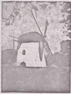
Mostert's Meul Kaapstad