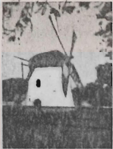
Mostert's Meul Kaapstad