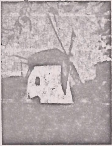
Mostert's Meul Kaapstad