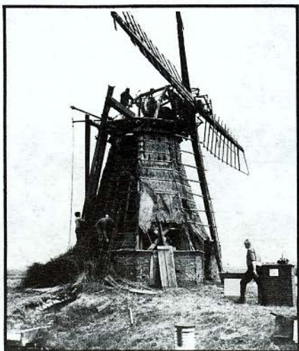
Een beeld van de werkzaamheden

De liggende roede werd met een slijpschijf doorgeslepen,