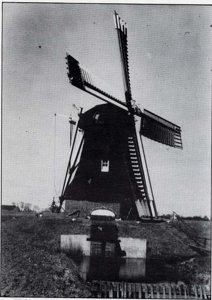
Poldermolen de "Langelandster Watermolen" in volle glorie.

leden van de Langelandster- en de Bovenrijgstermolenpolders en van de combinatie: de Lange Bovenrijgsterpolder. Het doek viel in 1970 zoals eerder gememoreerd. De molen ging mee over naar het waterschap Hunsingo en werd daarna overgedragen aan de Molenstichting Hunsingo en Omstreken.