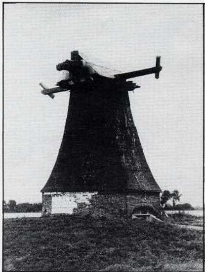
De geconserveerde "Langelandster Watermolen" op 5 augustus 1984.