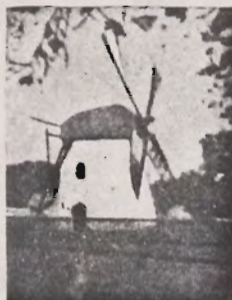
Mostert's Meul Kaapstad