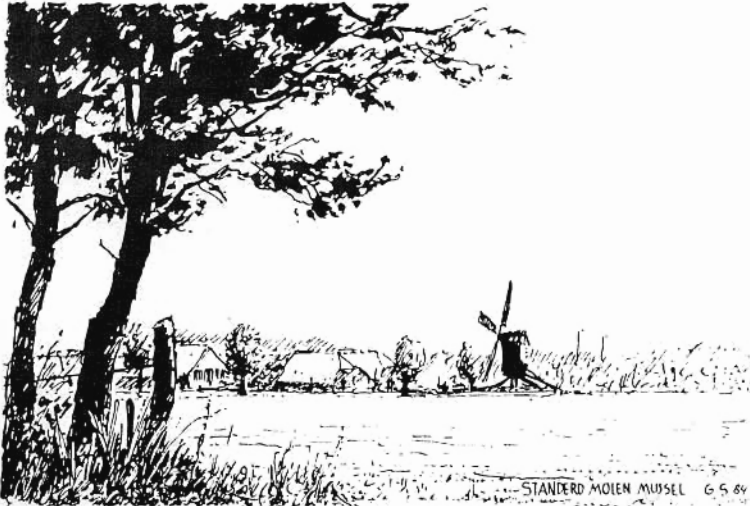
STANDERD MOLEN MUSEUM 65 64

Enkele onderdelen, waaronder het bovenwiel, werden toen benut voor het herstel van de vroegere standerdmolen uit het Gooise Huizen, die in 1916 in het museum weer werd opgebouwd. Dit bovenwiel is er trouwens na enige jaren weer uitgehaald en vervangen door een nieuwe. Het oude bovenwiel werd toen op het terrein onder een afdak opgeslagen en ligt daar nu, mei 1984, nog steeds.