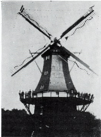
"De Korenbloem" in feesttooi ter gelegenheid van het 40-jarige regeringsjubileum van Koningin Wilhelmina, september 1938.