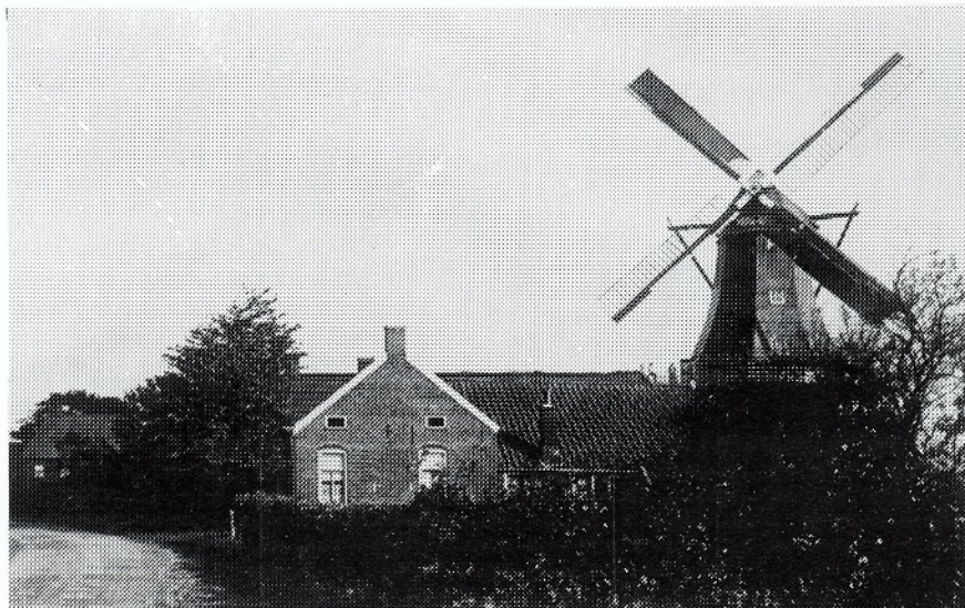
"De Korenbloem" te Vriescheloo in 1930, met de nieuwe roede (zonder zeilen).