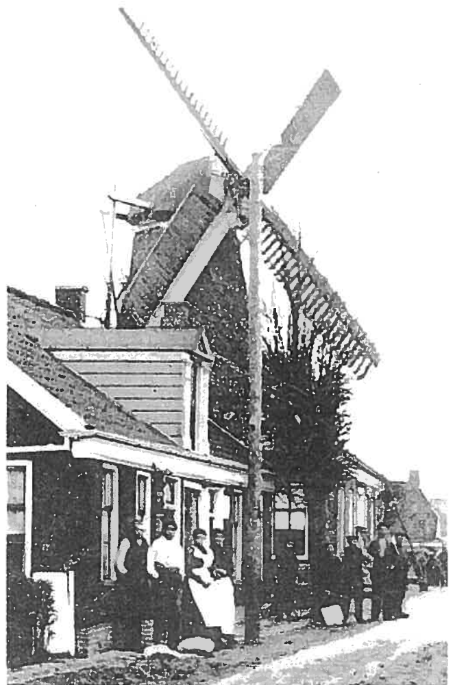
▲ De molen Hercules.