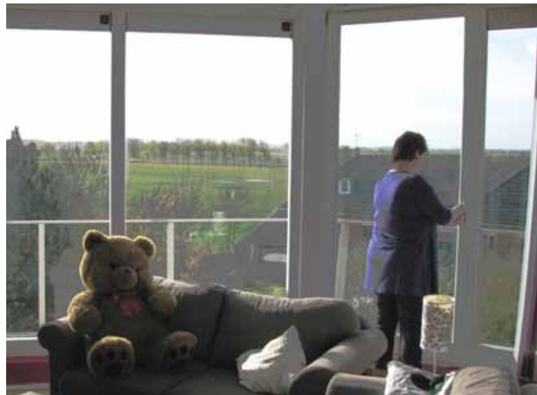
▲ BENEDEN – UITZICHT VOORMALIGE INRIT EEN ACHTKANTE KAPZOLDER MET EEN VIERVOUDIGE KAP ▲

Nou, het resultaat mag er zijn. Vanuit de hal kom je de woonkamer binnen, die is mooi licht ingericht. Van daaruit kun je in de tuin en op de weg kijken. Door twee openslaande deuren kom je in de ruime moderne woonkeuken met uitzicht op de grotendeels omheinde tuin helemaal rond de molen. Om ruimte te winnen is die in een aanbouw gerealiseerd. Door de hoge deuren valt veel licht naar binnen. Via een deur kun je vanuit de keuken de garage in, eveneens in die aanbouw. Omdat geen enkele muur in keuken en garage helemaal haaks staat, krijgen deze ruimtes iets levendigs - iets wat je mist in doorsnee woningen. Keuken en kamer hebben vloerverwarming. De rest van de molen verwarmen ze met radiatoren.