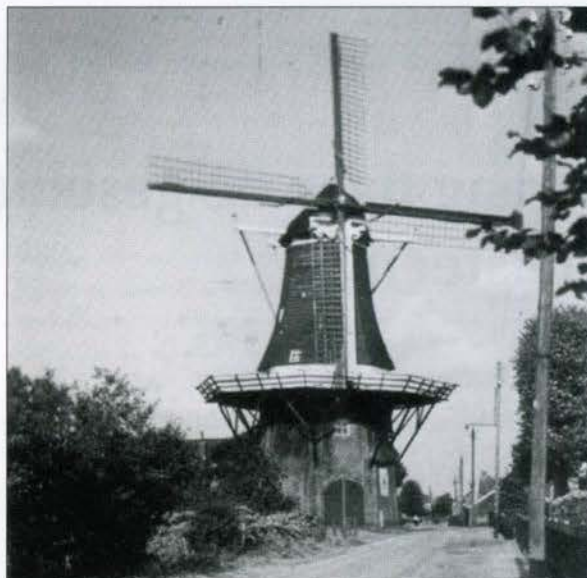
De korenmolen te Westerlee (Groninger Molenboek, 1981; p. 167)