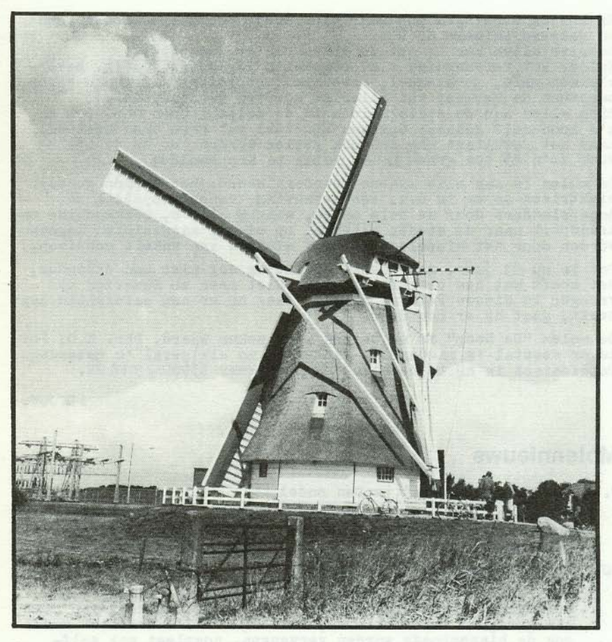
Korenmolen - grondzeiler "De Hoop" in Kropswolde. Men ziet, dat deze molen is uitgerust met Fauel-wieken en zelfzwichting.

die er toen erg verlaten en haveloos bij stond. Z'n zoon nam toen de molen in Nieuwe Pekela over. Toen de subsidieaanvrage voor een algehele restauratie rond was, gaf hij het molenmakersbedrijf Roemeling & Molema in december 1979 opdracht de molen te restaureren (begroting 3½ ton). Vroeger was deze molen de oliemolen van Helder te Vierverlaten.