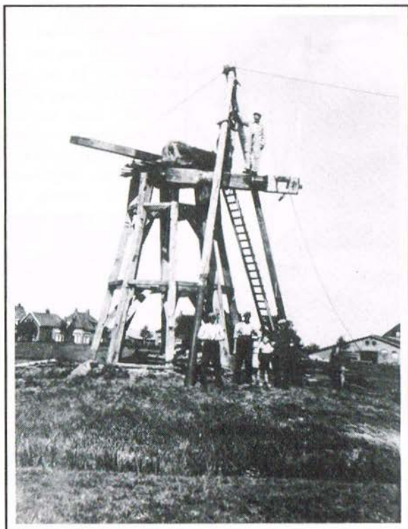
De eens zo trotse molen bijna gesloopt, met de slopersploeg nog eenmaal vereeuwigd, door W. O. B. Bakker.