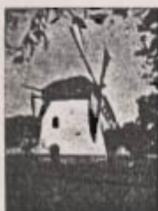
Moster's Moul Kaapstad