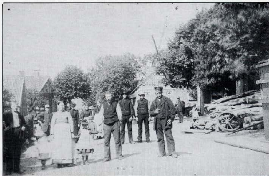
De Uiterburen te Zuidbroek . Boven het huisje zijn tussen de bomen door de kap en wien van de molen zichtbaar. Deze foto is waarschijnlijk voor 1884 genomen. Alle foto's van fam. Stukje te Borger (Dr.).

Toch bestaat er een foto, waarop een klein deel van de molen zichtbaar is. Fotograaf H. Frank uit de stad Groningen legde enkele jaren voor de brand enkele delen van