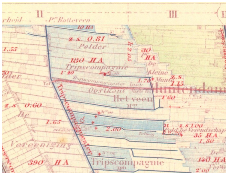
Detail Waterstaatskaart 1 e editie (1865 – ca 1935) Blad 12 Assen 2 met daarop de exacte ligging van de watermolen onder de letters pa van Tripcompagnie.

De hier beschreven molen was een windvijzelmolen, een achtkante bovenkruier van het type grondzeiler, met een rietgedekte achterkant op stenen veldmuren, met één roede voorzien van zelfziching en een vlucht van 15 meter. De middellijn van de vijzel was 1,14 meter. Het water kon worden opgevoerd tot 1,38 meter + W.P. en het wegmalen tot 0,34 meter + W.P. Over de precieze ligging verschillen de meningen. Als ik het internet doorzoek, kom ik diverse locaties tegen. Op de site van Dr. Jan van den Noort uit Rotterdam, historisch onderzoeker en cartograaf, jvdn.nl, staan diverse waterkaarten waarvan de beeldrechten al zijn verlopen en die je zo mag gebruiken. Op de Waterstaatskaart 1 e editie (1856 – ca 1935) Blad 12 Assen 2 kom ik de exacte ligging tegen. De molen stond in het midden van de polder en stond via een uitwateringskanaal (wijk) in verbinding met het Tripcompagniesterdiep. De wijk liep echter niet rechtstreeks, maar eerst 720 m naar het oosten (op dit punt sloeg de molen van de Kleine Munte uit), daarna 530 m langs de oostgrens van het schap naar het zuiden en vervolgens 1,5 km naar het westen.