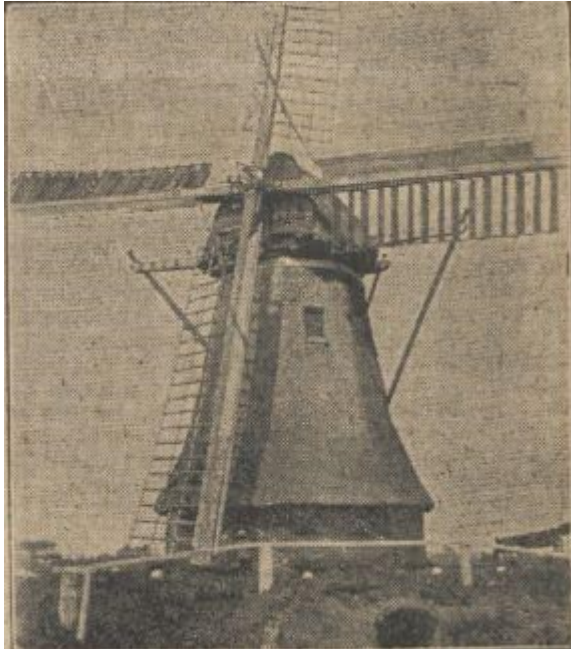
Krantenfoto uit het Nieuwsblad van het Noorden van 14 juni 1928. Dit is de foto aan de hand waarvan Michaël Flik zijn tekening maakte.

Uit de Noord-Ooster van 10 april 1928: Het WATERSCHAP vraagt tegen mei a.s.: Een Watermulder. Woning met grote tuin disponibel (= vrij beschikbaar). Aan te melden bij D. v.d. VEEN of F. FLIK Hzn. te Tripscompagnie.