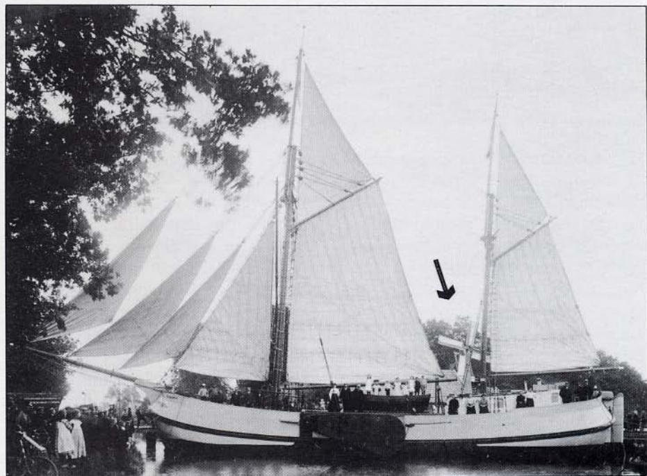
Koftjalk "Tjakiena", in 1910 gebouwd evenals het kleine hout zaagmolentje op de achtergrond.

De gegevens van B. van der Veen Czn. brachten uitkomst. Het gaat