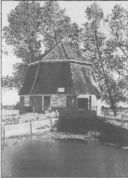
De molenromp van Bombay, gefotografeerd in september 1976.