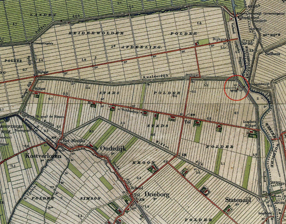
De Stadspolder ca.1910, gelegen tussen de Reiderwolderpolder en de Kroonpolder. In de noordoosthoek aan de Westerwoldse Aa staat de molen omcirkeld aangegeven (topotijdreis.nl).