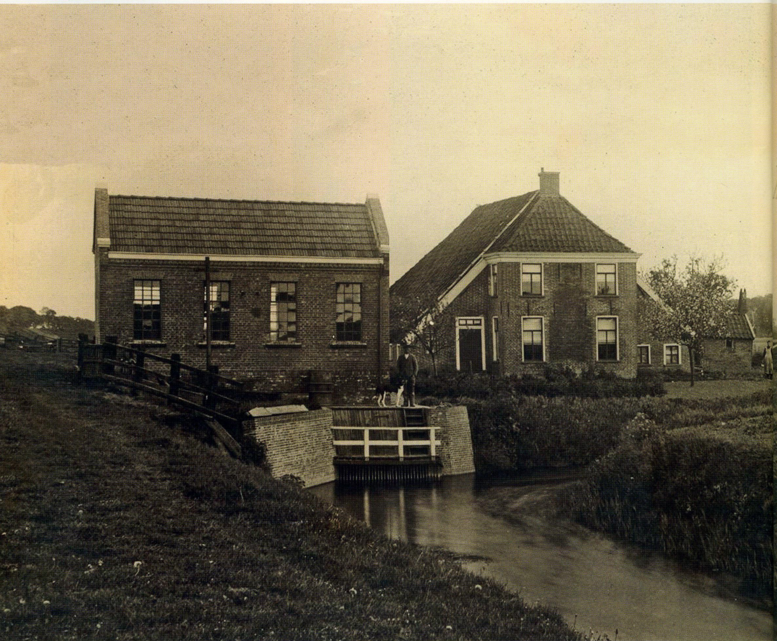
De hardnekkige onbekende, thuisgebracht als de molen van de Stadspolder bij Drieborg. Verder links net buiten beeld de dijk langs de Westervoldse Aa, dan het gemaal en de molenaars- en sluiswachterswoning met stookhut. De foto moet gemaakt zijn in 1916 of 1917.

de situatie op de kaart overeenkwam met die op de foto. Dat resulteerde uiteindelijk in een serieuze kandidaat: de molen van de Stadspolder aan de Westervoldse Aa in het oosten van de provincie tegen de Duitse grens aan. Het olopende talud links duidt op de aanwezigheid van een dijk, in dit geval zou dat de dijk langs de Westervoldse Aa zijn, waar de molen op uitsloeg. Ook de op de achtergrond aanwezige bomen passen goed bij die