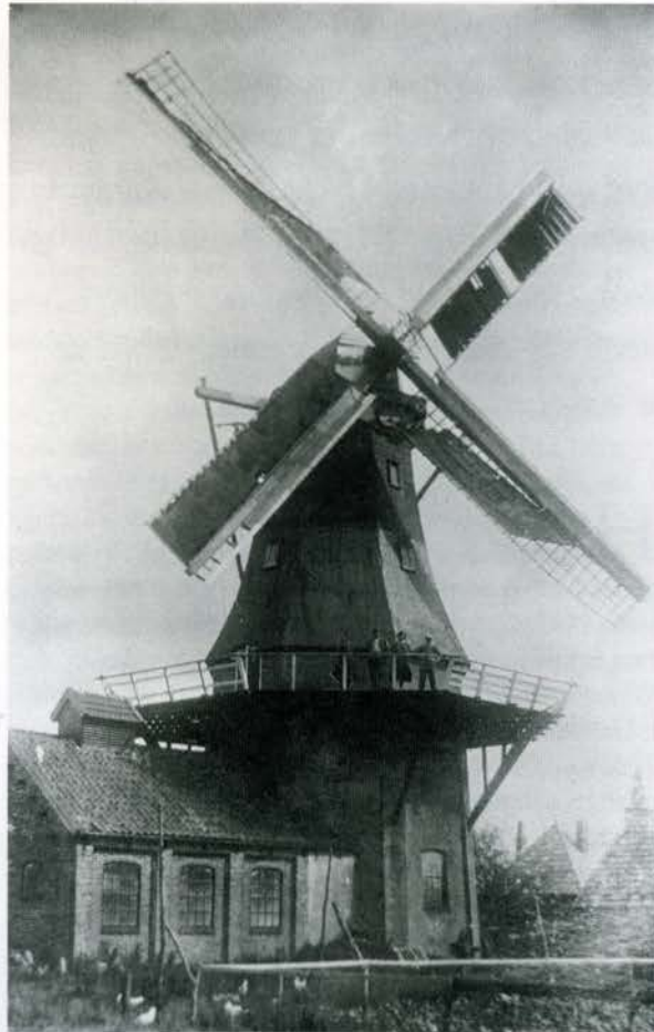
Molen de Wilp.