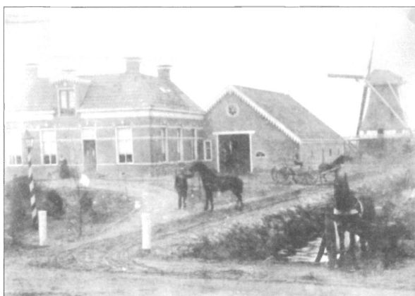
Een bijna(!) gelijke variant van deze foto is gepubliceerd in het Groninger Molenboek (pagina 177)

In De Nieuwe Zelfzwichter 2005/2 kwam een onbekende, Nederlands aandoende molen op Aruba aan de orde die toen al met hulp van het Groninger Molenarchief werd ontmaskerd als zijnde afkomstig uit Wedderveer (Groninger Molenboek: verdwenen molens, nummer 129). Het archief bezit foto's van de molen op de oorspronkelijke locatie - tegenover de spinnenkop.