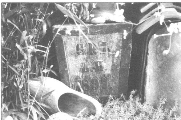
De sluitsteen is nog in Groningen